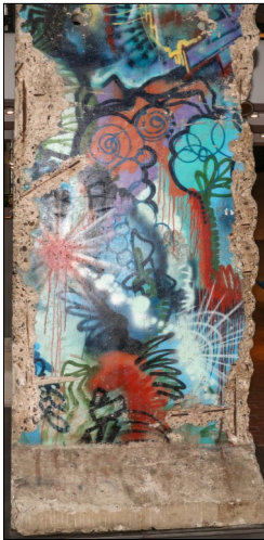
Fragment du mur de Berlin

Le 7 décembre dernier, nous faisons une belle escapade à Montréal en autobus de luxe, ce qui fut apprécié de tous.