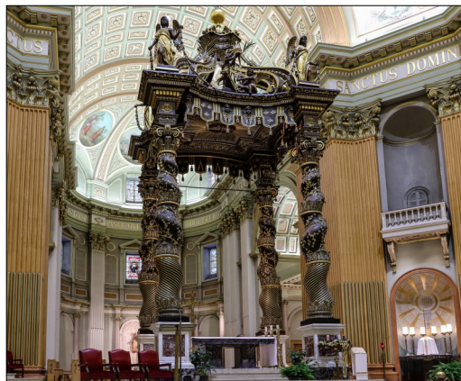
Baldaquin, basilique Marie-Reine-du-Monde

P.-S. – D'autres photos prises par Bernard Delisle se trouvent sur le site du secteur à www.areqbas-richelieu.ca .