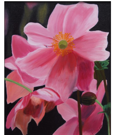
Œuvre de Danielle Champagne.