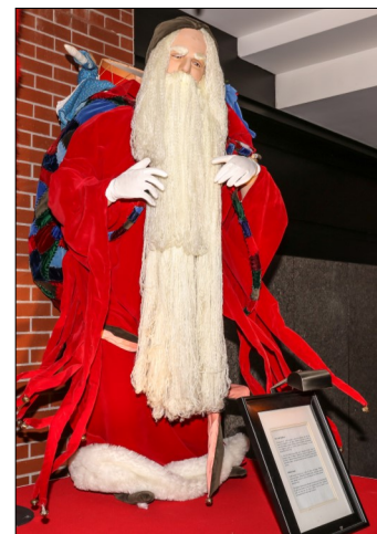
Père Noël médiéval